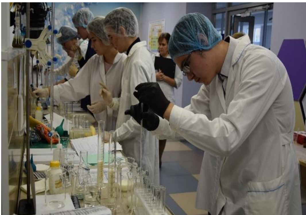
Республиканский химико-биологический хакатон «Формула жизни»

Учащиеся и студенты образовательных партнеров привлекаются в качестве волонтеров как при проведении мероприятий, так и в текущей деятельности технопарка в качестве кураторов проектных групп (Рис. 8-10).